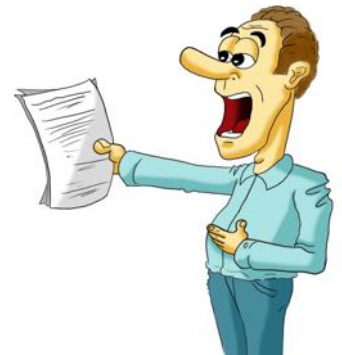
der Inhalt der Rede